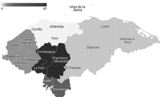
Figura 2 Áreas de intervención territorial hondureña

La sistematización de los PREUVS reveló una distribución geográfica heterogénea en los 18 departamentos que conforman Honduras. La región Central (Francisco Morazán, Comayagua y La Paz) concentró la mayor cantidad de intervenciones, con 43 proyectos. Le siguieron la región Sur (Choluteca y Valle) con 28 proyectos, la región Occidental (Ocotepeque, Copán, Lempira) con 17 proyectos, la región Norte con 10 proyectos y finalmente la región Orientalmente la menos con 2 proyectos. Esta distribución geográfica se muestra en la Figura 2, que representa la distribución de los proyectos en las regiones más.