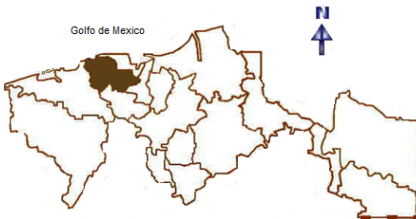
FIGURA 1. Localización de los sitios de El Cometa y La Ceiba en el municipio de Comalcalco, Tabasco. INEGI 2012

La investigación se realizó en el ejido Francisco I. Madero, Segunda Sección del municipio de Comalcalco, Tabasco; México en la región de la Chontalpa, ubicado en las coordenadas 18°15'42.15" LN y 93°22'5.92" LW a una altitud de 0-10 msnm. Presenta clima cálido húmedo con abundantes lluvias en verano, con precipitación anual de 1500 – 2500 mm; y con temperatura de 28 ± 30° C. Colinda al norte con el municipio de Paraíso, al este con los municipios de Paraíso y Jalpa de Méndez; al sur con los municipios de Jalpa de Méndez, Cunduacán y Cárdenas, al oeste con el municipio de Cárdenas. La extensión territorial del municipio es de 723.19 km 2 , sobre el cual se asientan 90 rancherías y 30 ejidos (INEGI 2012) (Figura 1). Los sitios de estudio fueron los predios El Cometa y La Ceiba.