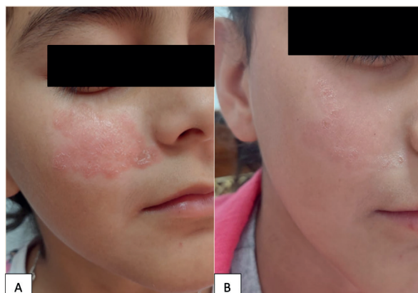
Figura 5. A. Antes del tratamiento B. Después del tratamiento.