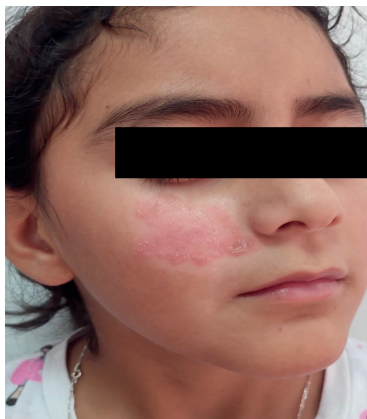
Figura 1. Placa eritemato-escamosa circinada, pómulo derecho de 2.8x2.3 cm de diámetro.

Se realiza examen directo con Hidróxido de Potasio (KOH) al 10% donde se evidencia la presencia de hifas hialinas gruesas (figura 2). También se realiza cultivo en Agar Sabouraud más Cloranfenicol (figura 3), a los 8 días hubo crecimiento de colonias pulvulentas, color beige, a la microscopia con azul de lactofenol se observaron macroconidios en forma de huso con 4 a 6 lóculos característicos de Nannizzia gypsea , (figura 4). Se deja tratamiento con Itraconazol 100mg 1 tableta diario por 3 semanas más Ketoconazol crema 2% cada 12 horas por 1mes, en su cita de seguimiento, a las 3 semanas se observa mejoría significativa y se extiende tratamiento por dos semanas más, (figura 5).