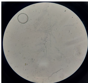
Figura 2. Examen directo. KOH 10% visión 40X, hifas hialinas gruesas.