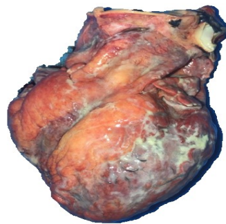
Fotografía 2. Corazón con secreción purulenta en pericardio.

Masculino, 74 años de edad, con historia de fiebre, tos, disnea y mal estado general, de 15 días de evolución, postrado, hasta que fallece, estando solo en su casa de habitación, por lo que es remitido a autopsia médico-legal. El hallazgo principal de la autopsia fue en cavidad pericárdica encontrando: a) Abundante secreción purulenta de aproximadamente 450 ml. ( Fotografía 1 ) y b) corazón, con presencia de material blanquecino en pared del pericardio ( Fotografía 2 ). Los pulmones se observaron con secreción purulenta y adherencias. El reporte histopatológico reportó pericarditis aguda supurada (Causa inmediata de muerte), bronquitis aguda supurada y hemorragia pulmonar.