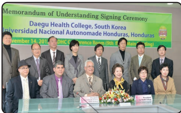
Figura N°2: Ceremonia de firma de Memorandum de entendimiento con Daegu Health College.