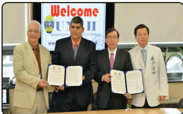
Figura N°3: Ceremonia de firma de Convenios de cooperación.