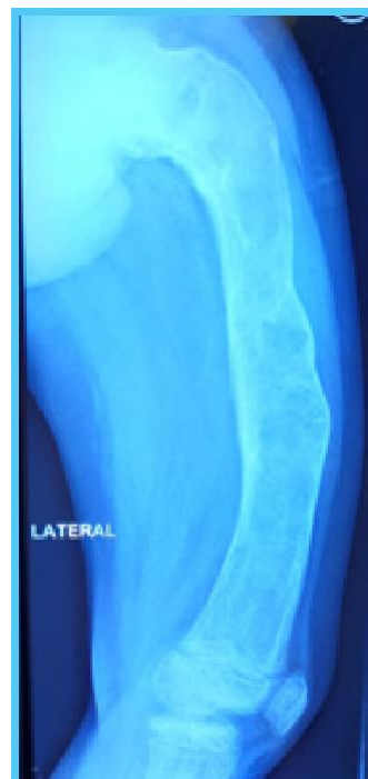
Figura No 2: Radiografía (RX) Lateral de fémur izquierdo, con imagen expansiva con áreas líticas, dispersas, que involucra epífisis, metáfisis proximal y diáfisis, con ligera angulación del mismo.