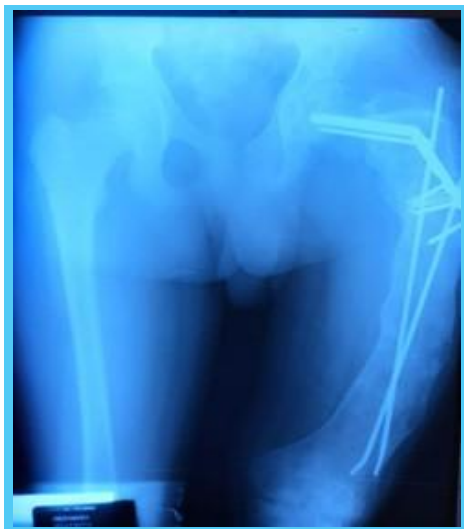
Figura No. 3: RX Antero Posterior de pelvis y ambos fémures, apreciando fémur izquierdo con lesión expansiva, que provoca engrosamiento de todo el fémur, con áreas líticas y material de osteosíntesis a nivel de cadera y fémur.