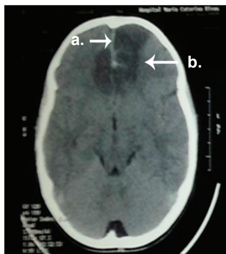
a. Falx cerebri u hoz del cerebro b. Hipodensidad frontal

Paciente continúa con deterioro del cuadro clínico en las siguientes 24 horas. Se realizó una segunda TAC cerebral, la que se visualiza en la figura No. 2.