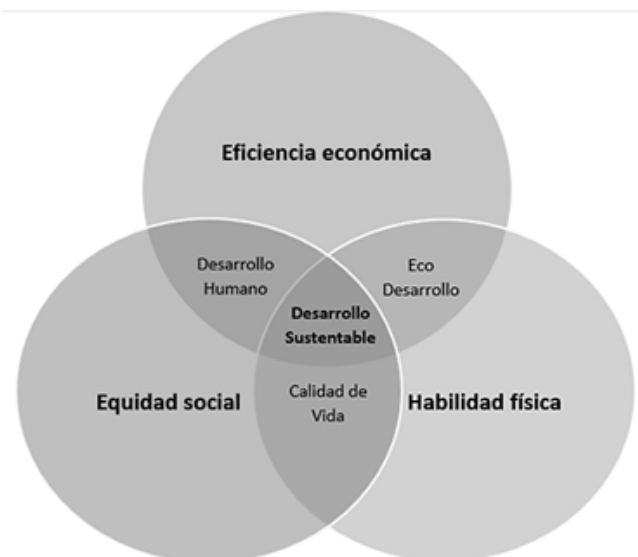
Figura N°1 Integración de objetivos orientados al desarrollo

Acercar ciudad-urbanización-metrópoli, tendrá por resultado un coctel propicio para hablar de áreas inteligentes o ciudades inteligentes en lo individual; y, en lo colectivo, metrópolis no difuminadas con rediseños pertinentes. Porque la ciudad es un entramado complejo es indispensable comprender que la integración de sus elementos que se orientan al máximo desarrollo y las aspiraciones plurales del común de los ciudadanos.