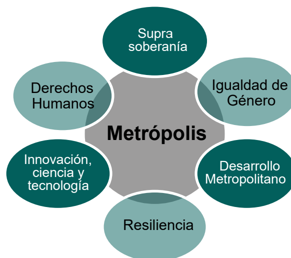
Figura N°3 Configuración Ontológica Metropolitana

La Figura N°3 define simbólicamente al menos seis elementos que ontológicamente puntualizan las metrópolis.