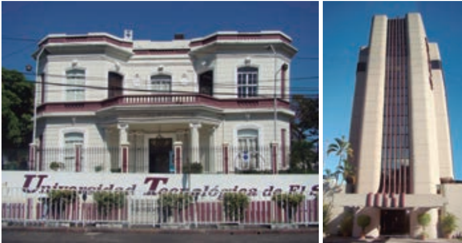
Fotografías 1 y 2: imágenes que muestran la diferencia entre el nuevo edificio de Los Fundadores , y el edificio Anastasio Aquino , casa de principios de siglo XX que actualmente alberga al MUA.