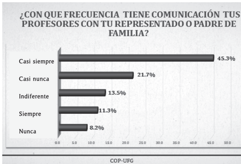
Gráfico 2. Frecuencia en la comunicación del docente con los padres de familia.