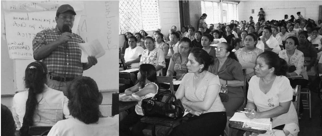
Segundo Taller sobre la Iniciativa Mundial de Reconciliación 2009, impartido por el Instituto "Martin Luther King" de la UPOLI, a más de 100 mujeres dirigente de distintos sectores productivos y sociales de Nueva Guinea.