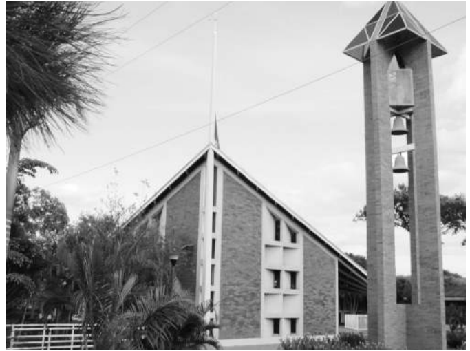
Capilla y Campanario de la UPOLI.

para la diseminación y aplicación de la Política Institucional de Equidad de Género.