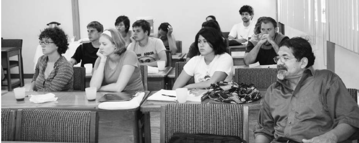
Estudiantes de universidades norteamericanas recibiendo curso de Cultura de Paz, impartido por docentes del Instituto "Martin Luther King"-UPOLI.

teniendo en cuenta sus diferentes necesidades. En una situación de equidad de género, los derechos, responsabilidades y oportunidades de los individuos no se determinan por el hecho de haber nacido hombre o mujer.