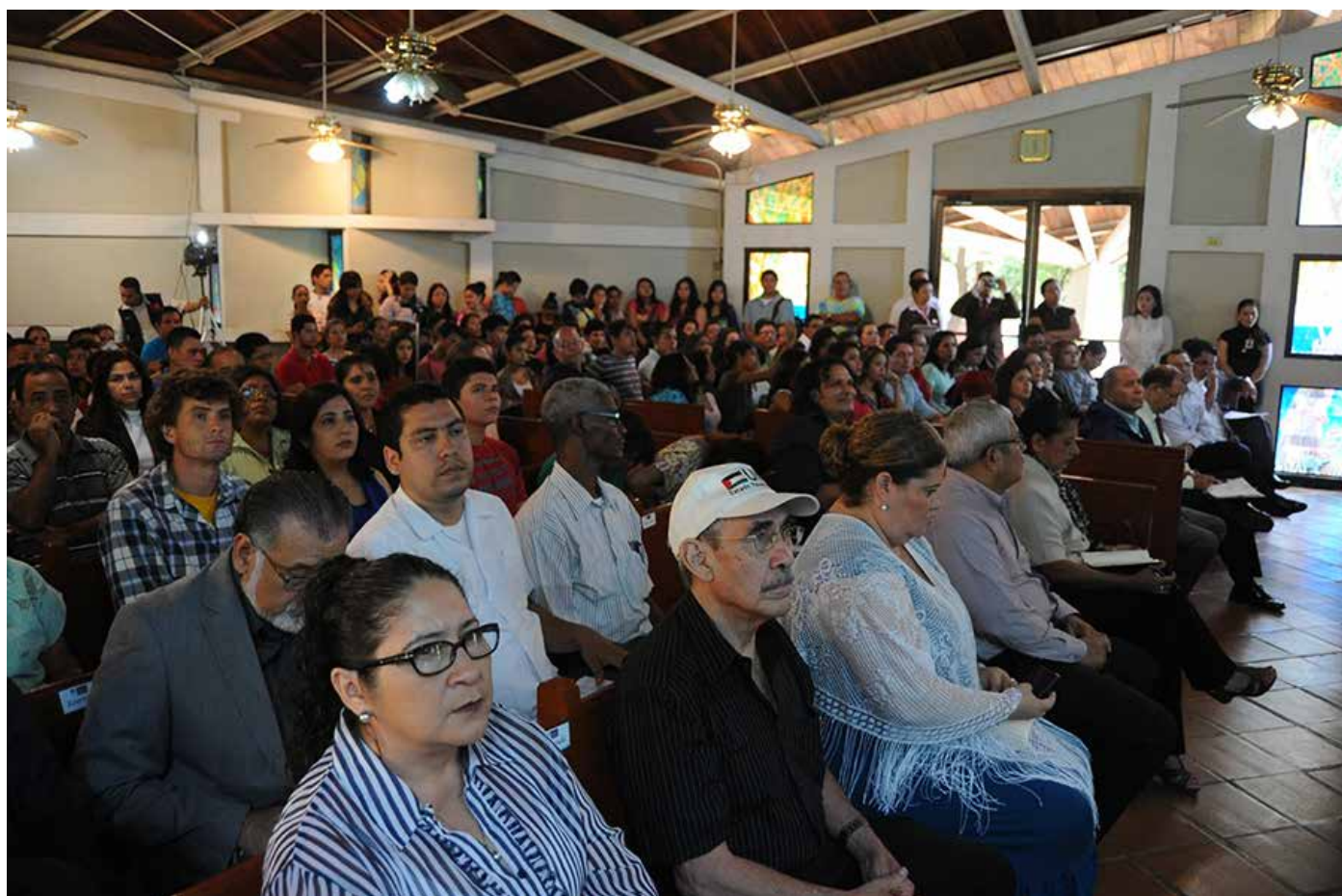
Público asistente a la Conferencia Magistral del Embajador de Palestina.

En la guerra de noviembre 2012, Israel asesinó al jefe militar de Hamas y producto de esto inicio la guerra que duró una semana donde murieron 191 personas y 1,500 heridos, la mayor parte de ellos civiles además de la destrucción de infraestructura (casas, instituciones, centros de educación).