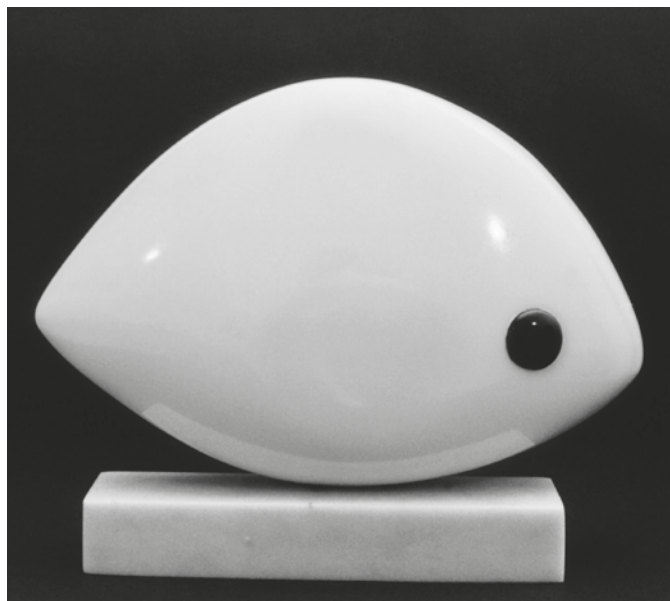
Autor: Ernesto Cardenal.

Federico Mayor Zaragoza 03 de marzo de 2020.